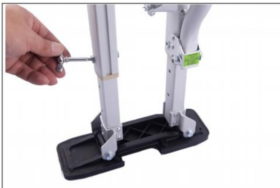
Křídlové šrouby pro nastavení výšky

Při nastavování výšky chůd odstraňte křídlové šrouby. Po jejich vyjmutí pomalu přizpůsobte chůdy do požadované výšky. Když je výška chůd nastavena, zarovnejte otvory s kroužky v nohách chůd pro motýlové šrouby a šrouby pevně utáhněte. Ujistěte se, že jste je nepřipecnili příliš pevně, protože by to mohlo mít nežádoucí účinek.